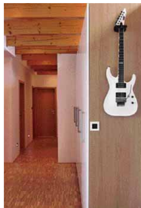
LUXUSNÍ A ROBUSTNÍ DOJEM VYPÍNAČŮ

TEXT A PRODUKCE: Martina Veselá