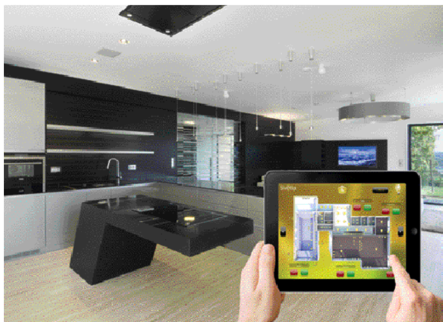
2 REZIDENCE 3/2013

rovými nástěnnými tlačítky. Tlačítka je možné flexibilně umísťovat po domě (bytu). Světlo v interiéru či exteriéru můžete díky aplikaci domácí automatizace ovládat odkudkoliv, ať už jste doma, na zahradě, na dovolené nebo v kanceláři.