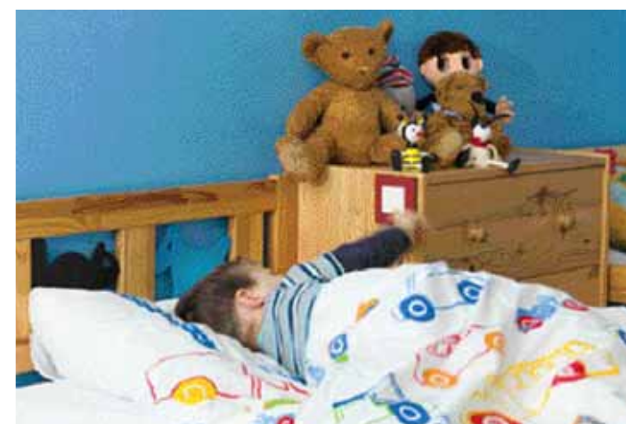
POHODLÍ I PRO NEJMENŠÍ