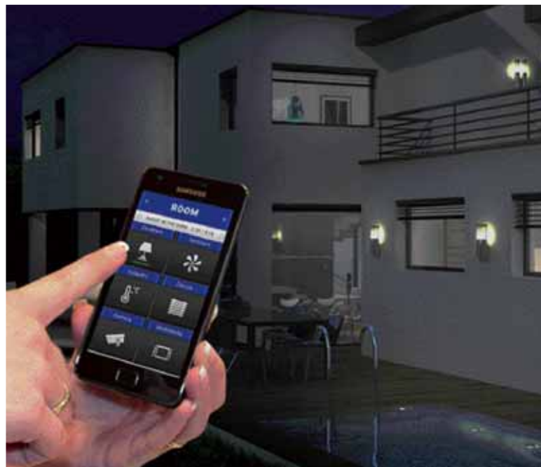
SYSTEM CHYTRÉHO BYDLENÍ