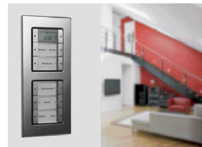
POMOCÍ GIRA TLAČÍTKOVÉHO SENZORU

OBÝVACÍ POKOJ ovládaný systémem iNELS . Jediným dotykem na iPadu nebo chytrém telefonu můžeme měnit pomocí osvětlení atmosféru místnosti. iNELS , www.inels.cz