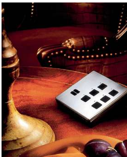
CHYTRÁ KRABIČKA Jedním tlačítkem nastavíte světla na romantickou večeři, dalším třeba na intimní chvíly v ložnici.